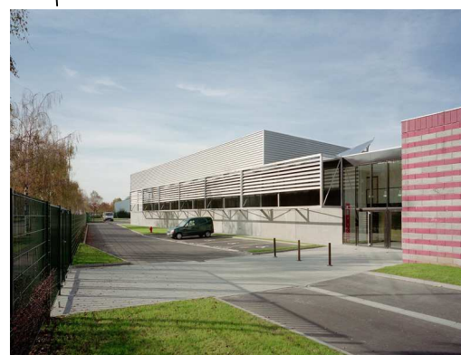
Hall des Sports « le chêne », 1 rue du stade

Horaires et plans : http://www.cts-strasbourg.fr/